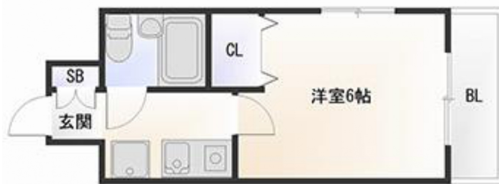
入居先物件の間取り一例